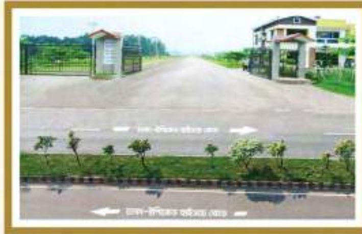
আলোকিত বাংলাদেশ ঢাকা-ইপিজেড হাইওয়ে রোডের সাথেই