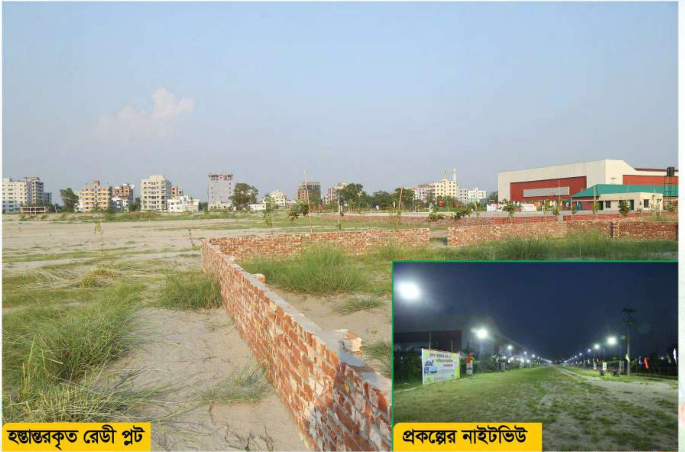
হস্তান্তরকৃত রেডী প্লট