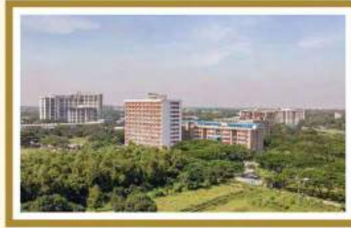
আশুলিয়া মডেল টাউন আশুলিয়া, উত্তরা সংলগ্ন