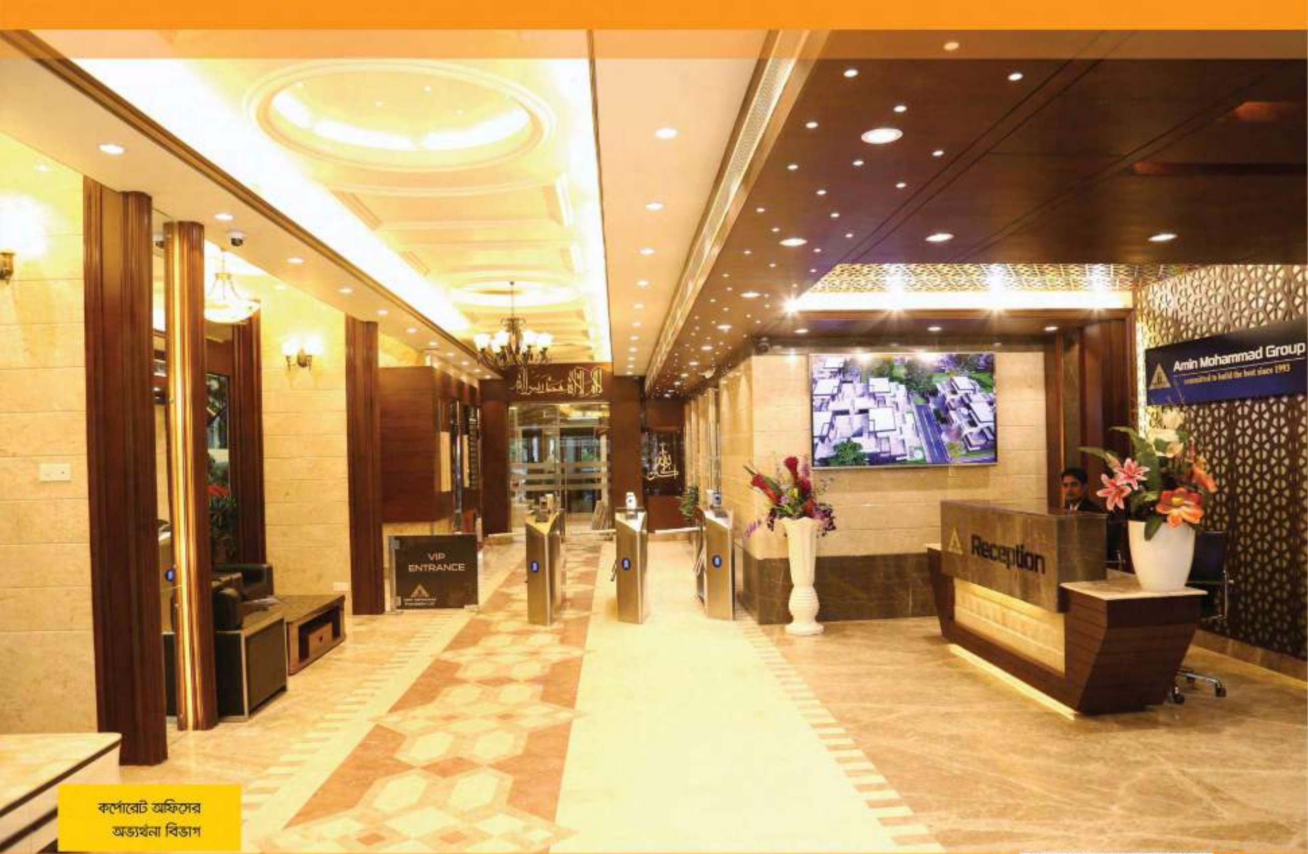
কর্পোরেট অফিসের অভ্যর্থনা বিভাগ