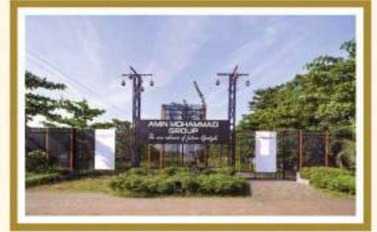
আমিন মোহাম্মদ টাউন ঢাকা-আরিচা মহাসড়ক সংলগ্ন...