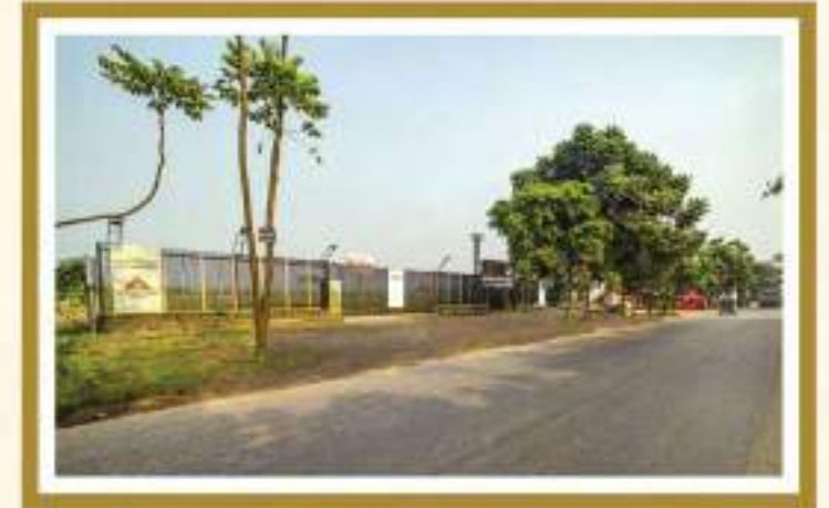
হীন বনশ্রী রামপুরা বনশ্রীর সাথেই অবস্থিত