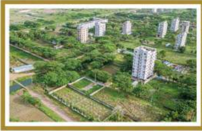
হীন মডেল টাউন মতিঝিল সংলগ্ন